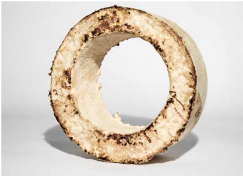
The Growing Lab - Mycelium Wheel @Officina Corpuscoli